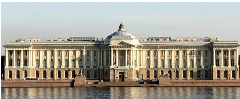
Санкт-Петербурзька Академія мистецтв

Підтвердження цієї історії міститься у «Спогадах» Марії Федорівни Каменської (1817–1898), дочки віце-президента Академії мистецтв, графа Федора Петровича Толстого (1783–1873). Вони були опубліковані в 1894 р. в журналі «Історичний вісник». М.Ф. Каменська називає І.П. Мартоса «хохол з духовного звання», а в іншому місці пише «недарма він походив з духовного звання». В Академії мистецтв, мабуть, пам'ятали, що саме священник чи дякон привіз майбутнього скульптора з України в Санкт-Петербург.