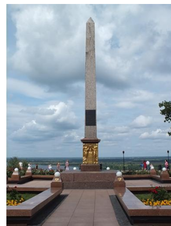
Обеліск в честь Кузьми Мініна і Дмитрія Пожарського в Нижньому Новгороді

Видатний російський скульптор-монументаліст Іван Петрович Мартос на віки прославив рідне містечко Ічнію, написавши 200 років тому на звороті плити пам'ятника Мініну і Пожарському, встановленому на Червоній площі в Москві: «Сочинил и изваял Иоанн Петрович Мартос родом из Ични». До цього, як то кажуть, ні відняти, ні додати нічого. І не варто вигадувати те, чого не було в дійсності, потрібно просто пишати своїм геніальним земляком і шанувати його пам'ять.