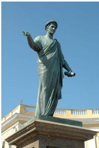
Пам'ятник герцогу де Рішельє в Одесі

вершина обеліска. Для порятунку виконаного замовлення і сімейних грошей в Нижній Новгород прибули І.П. Мартос зі своїм зятем А.І. Мельниковим і гранувальники з Академії мистецтв. Стовбур обеліска довелося вкоротити на 1,5 метра. Відколоту частину насадили на металевий стрижень і заполірували шви. Ці шви зараз проступають на монументі.