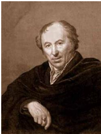
Іван Петрович Мартос. 1819 р. (художник О.Г. Варнек )

На початку 2018 року в Державному Історичному музеї Москви відкрилася виставка, присвячена 200-річчю пам'ятника Мініну і Пожарському. Монумент був встановлений на Червоній площі і урочисто відкритий 20 лютого 1818 року в присутності імператора Олександра І. Автором пам'ятника був російський скульптор Іван Петрович Мартос. Видатний митець є нашим земляком, його дитячі роки пройшли в містечку Ічня на Чернігівщині.