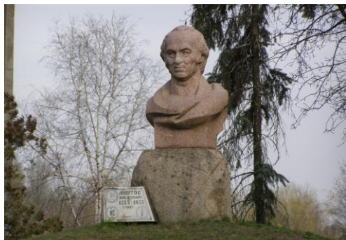
Пам'ятник Івану Мартосу в Ічні (скульптор В.Луцак, архітектор І.Сидоренко)

Пам'ять про знаменитого скульптора Івана Мартоса дбайливо зберігається на його малій батьківщині у місті Ічня Чернігівської області. Іван Мартос є гордістю місцевих жителів, його називають генієм із Ічні, 1980 р. вдячні ічнянці встановили йому пам'ятник в центрі міста, а до 225-річчя від дня його народження про життя і творчість скульптора був знятий документальний телевізійний фільм. Є в місті і вулиця Івана Мартоса.