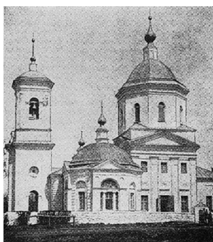
Знаменська церква в садибі Каріан

Іван Іванович Величко помер 11 грудня 1911 р. у віці 82 роки майже в один день з графом Павлом Сергійовичем Строгановим, який помер у Санкт-Петербурзі 17 грудня. Поховали І. І. Величка на почесному місці біля Знаменської церкви.