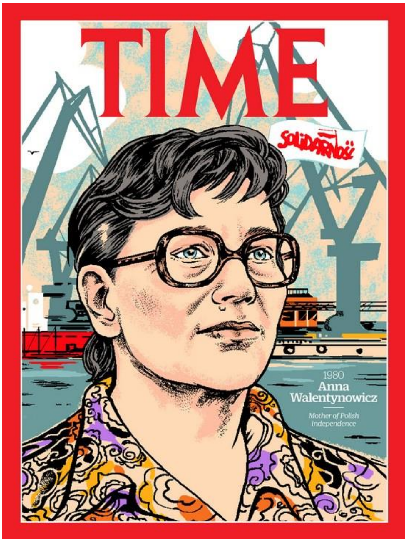
Часопис "TIME" назвав Українську мати польської "Солідарності" Анну Валентинович - однією з найвпливовіших жіноу XX століття

На честь цієї легендарної постаті Сейм Польщі проголосив 2019 рік – Роком Анни Валентинович.