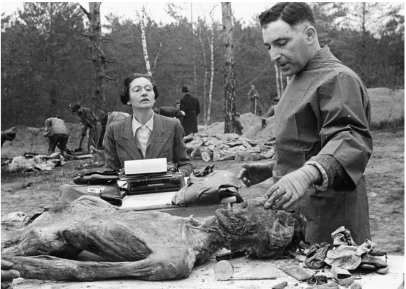
"Година папуги. 13 квітня та інші нещасливі дні" Більше про розслідування Катинського злочину читайте в публікаціях Олександра Зінченка

Ми робимо все, щоб захистити їх від повторень жахів тоталітарної системи і ненависницьких ідеологій, збудованих на повній зневазі до людського життя.