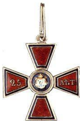
Орден Св. Володимира 4 ст.

Лев Миколайович Величко (1827-1902) навчався у Другій Санкт-Петербурзькій гімназії, після закінчення якої вступив на військову службу в Кірасирський принца Альберта Пруського полк, 20 квітня 1851 р. в чині корнета перевівся в Лейб-гвардії кірасирський Її Величності полк, а з 29 червня 1853 р. в чині поручика продовжив службу в Гусарському герцога Саксен Веймарського (Інгерманландському гусарському) полку. Цей полк входив до складу 2-ї бригади (6-та легка кавалерійська дивізія), якою командував його дядько, генерал-майор І. І. Величко. У складі Інгерманландського гусарського полку Лев Величко брав участь у Кримській війні, обороняв Севастополь.