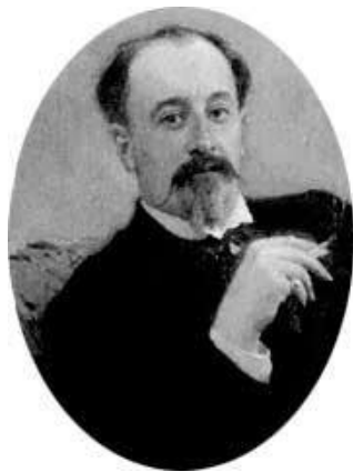
Василь Львович Величко

Син Льва і Анастасії Василь Львович Величко (1860-1903) – найяскравіша і неординарна постать з славного козацько-старшинського і дворянського роду Величків. Про нього написано десятки біографій та статей, є велика стаття в російській Вікіпедії.