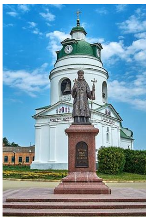
Миколаївська церква на Сорочинцях. Прилуки, вул. Галаганівська

Також виділив землю під церковний погост для нової церкви Іоанна Богослова в селі Хаєнки, яку збудували в 1861 р., і 33 десятини орних земель та сінокоосу для священика.