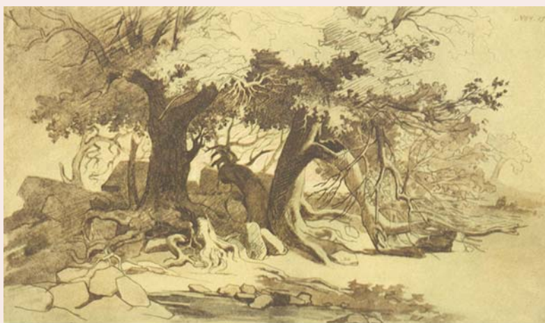
24. МАНГИШЛАЦЬКІЙ САД. Туш, перо, сепія, білий. [1851–1852].

Щось подібне чекало на нас і в колишньому форті. Хіба що голубило Каспійське море, підперезане сліпучими пісками. Навіть зелена оаза поселення, навіть вербовий гай, який колись започаткував український вигнанець, мало тишили око. Та добре, що казахи свято шанують нашого Пророка, створили музей, зберегли земляночку, в якій ховався від пекучого сонця зморений неволею солдат, дбають і про верби – як символ