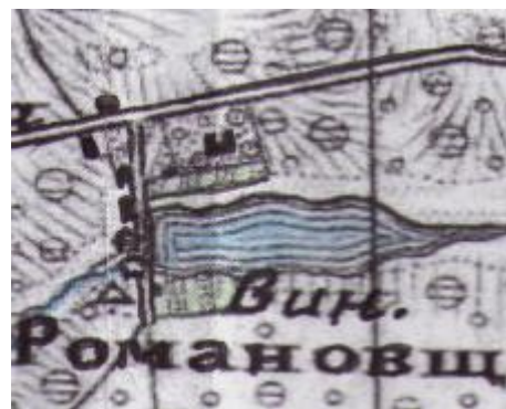
Романовщина на військовій карті другої половини XIX століття

Садиба Романовщина стала родовим гніздом Горленків-Дабіж. Вона розбудовувалася з кінця XVIII століття і досягла розквіту в 80-ті роки XIX століття. Загальна площа садиби становила 65 гектарів. Був побудований палац, що не поступався по пишноті палацу в Іваниці. Палац мав форму дуже видовженої літери П, в