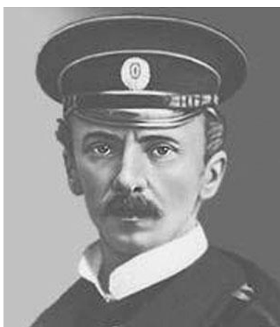
Петро Петрович Шмідт