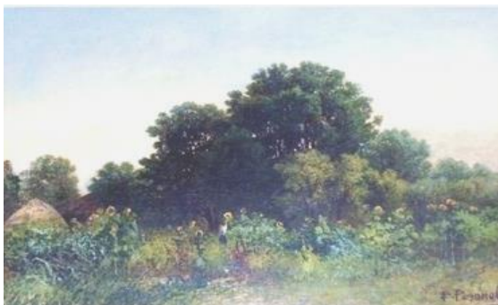
Соняшники. 1860-і роки, полотно; олія (Галерея живопису «Раритет», Мінськ)

Зараз картини В. Резанова виставляються на продаж на художньо-мистецьких аукціонах, зокрема, в Росії було виставлено три живописних полотна художника: «Біля водяного млина» (1866), «Дівчина на полі з соняшниками» та «Пейзаж» (1860-ті роки), а також рисунок «Тростянець» (1863), сепія. А в Мінську виставлено на продаж живописне полотно «Соняшники».