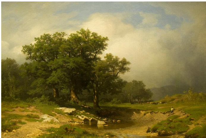
Дубовий гай на околиці Дюссельдорфа. 1866, полотно; олія (Державний Російський музей)

З робіт художника того періоду, написаних з натури, збереглася картина «Дубовий гай на околиці Дюссельдорфа», яка нині експонується в Державному Російському музеї у Санкт-Петербурзі.