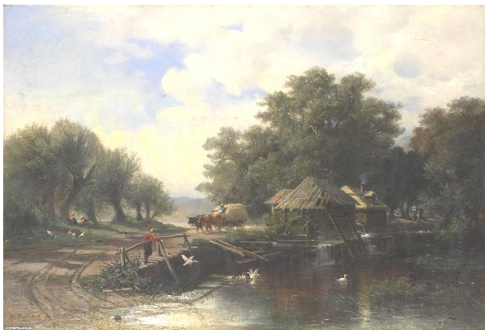
Біля водяного млина. 1866, полотно; олія (приватне зібрання)

А картини придбав для своєї колекції адмірал М.К. Краббе, тодішній морський міністр Росії.