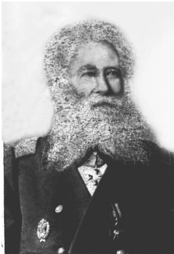
Віктор Михайлович Резанов. Вільно, 1880-ті роки

Ім'я уродженця Ічнянщини Віктора Михайловича Резанова, художника-пейзажиста, академіка Імператорської академії мистецтв, до недавнього часу було відоме лише вузькому колу мистецтвознавців, колекціонерів творів живопису та місцевим краєзнавцям.