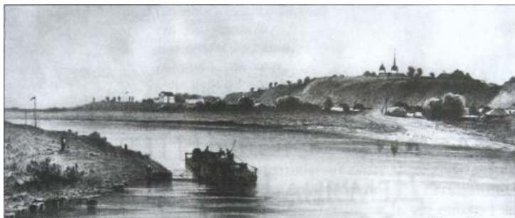
Загальний вигляд Батурина з боку річки Сейм. Літографія за малюнком В. Резанова 1860-х років

В 1867–1872 рр. художник багато подорожував, відвідуючи і Чернігівщину, про що свідчать його картини, які з'являлись на виставках у Академії мистецтв: «Два види в Новгородській губернії» (1867), «Вид в Малоросії» (1869), «Вид в Орловській губернії» (1872).