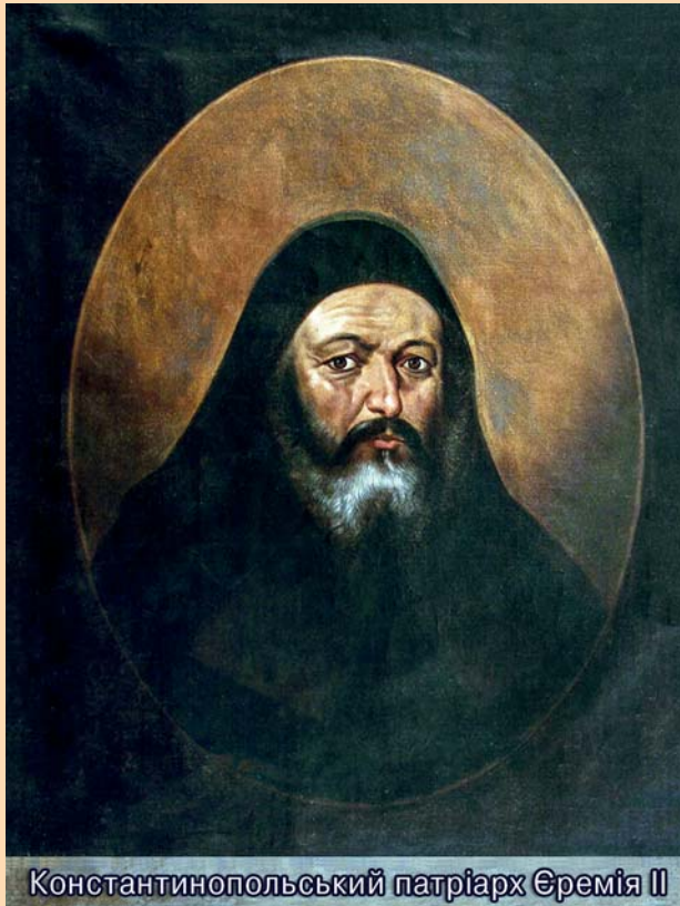
Константинопольський патріарх Єремія II

Монголо-татари руйнують Київ, місто втрачає своє політичне значення. Митрополити переносять резиденцію на північ – у місто Владимир, але – як і раніше – називають себе "київськими".