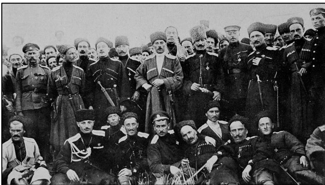
Офіцери Кавказької тубільної кінної дивізії. 1917 р.

Першим командиром Кавказької тубільної кінної дивізії був великий князь Михайло Олександрович Романов, молодший брат Миколи II. Власних офіцерських кадрів у дивізії не вистачало, офіцерський корпус поповнювався добровольцями. Служити в Дикій дивізії було престижним серед вищої російської знаті, у тому числі і кавказької, служили там султани і хани, грузинські та абхазькі князі і навіть перські принци, а також представники знатних князівських та графських родів Росії і європейської знаті.