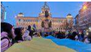
"Підтримую Україну": за кордоном відбулися акції на підтримку країни