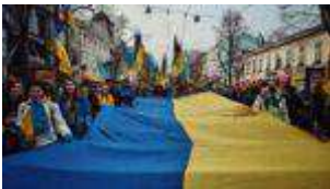
"Вова, не делай маме нервы": в Одесі тисячі людей вийшли на марш Єдності України